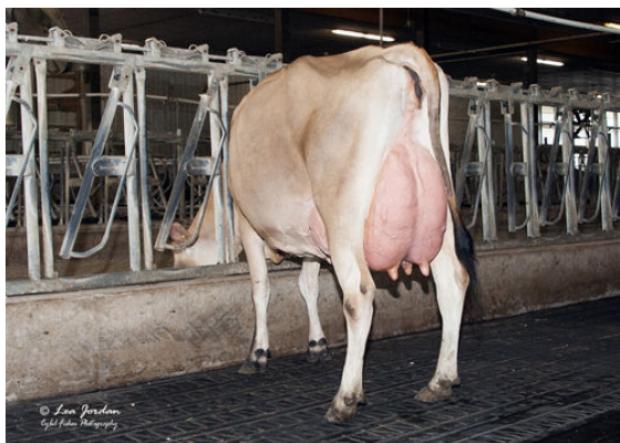
RIVER VALLEY LSTWL MACNCHEZ 5055