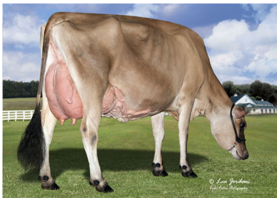
RIVER VALLEY LSTWL MACNCHEZ 5055