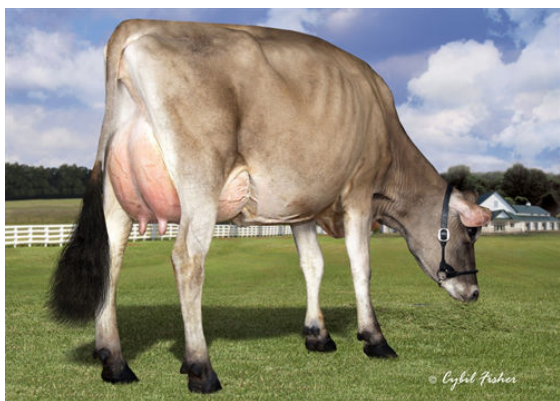
JER-Z-BOYZ MACNCHEZ 48947